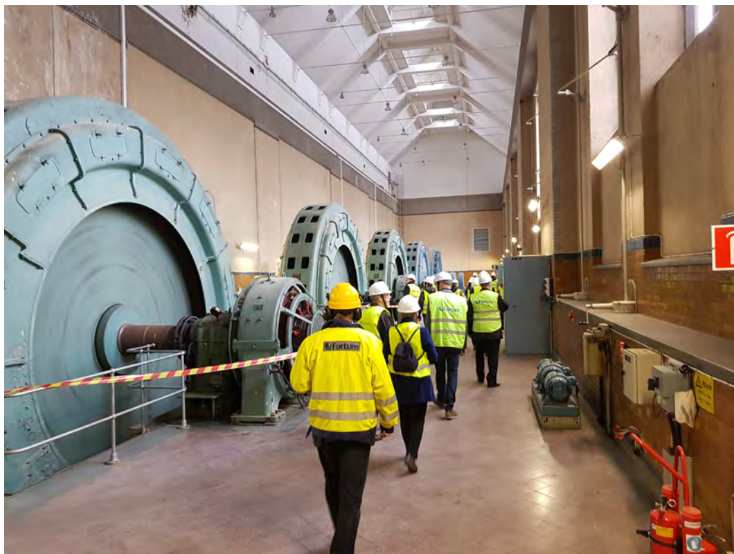
Syn på huvudförhandling om Untra kraftverk i Dalälven.