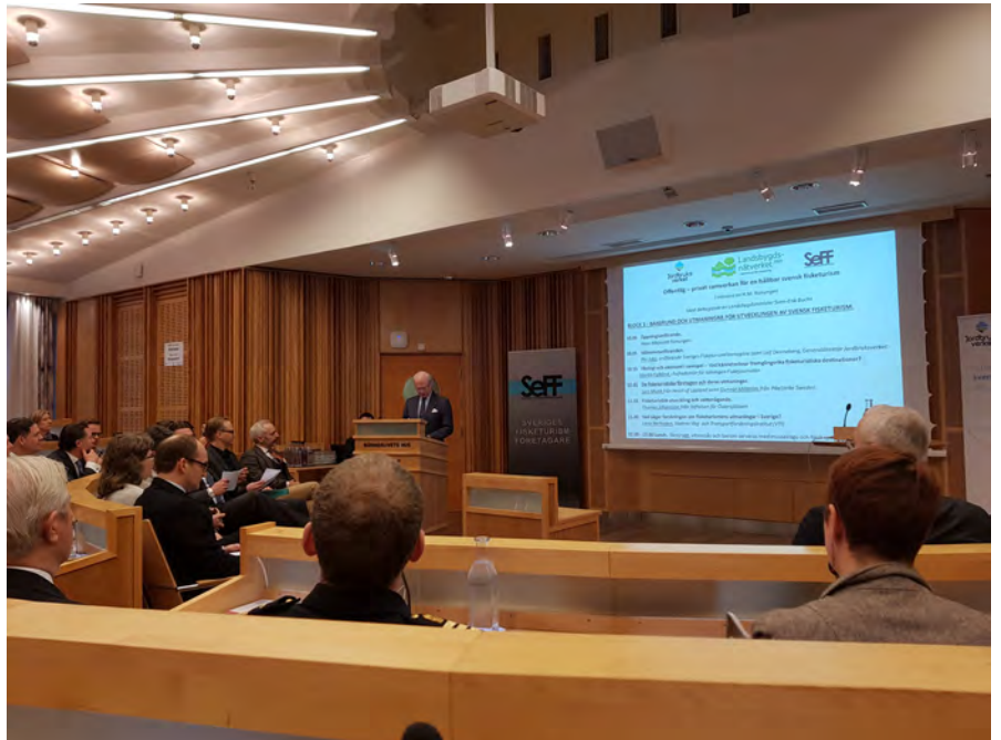
Fiskeforum 2018, HMK inledningstalar

Vi har haft sex fysiska möten med samarbetsgruppen, som består av Älvräddarna, WWF Världsnaturfonden, Naturskyddsföreningen och Sportfiskarna under 2018-2019. Vi diskuterar uteslutande vattenkrafts- och dammrelaterade frågor och gör gemensamma debattartiklar, utspel och uppvaktningar av både myndigheter, regeringskanslin och riksdagsledamöter/partier.